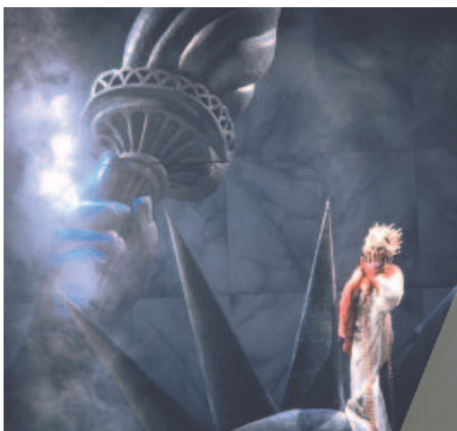
Caligula - Théâtre National de Belgique