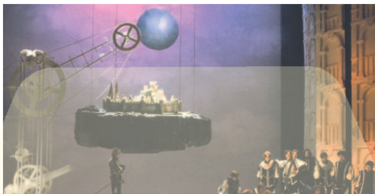
Cyrano de Bergerac - Théâtre National de Belgique