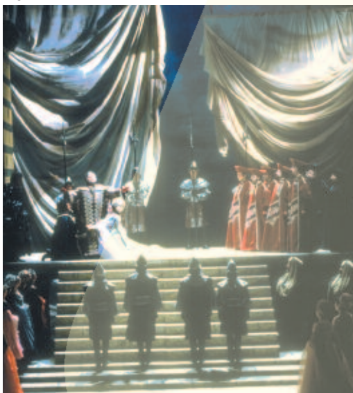
Bocca Negra - Opéra Royal de Wallonie