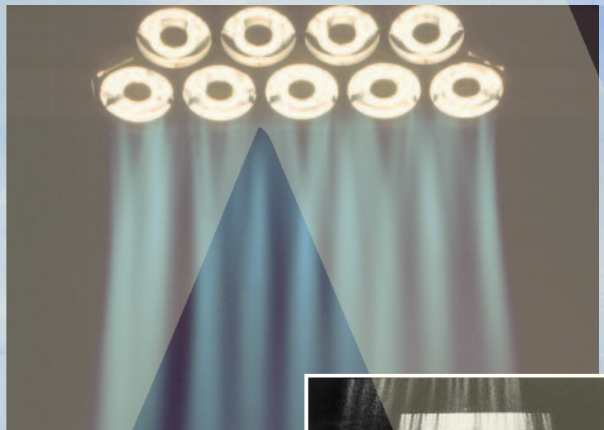
Le véritable "rideau de lumière"

Svoboda cherchait depuis longtemps un décor fait de lumière uniquement. Le résultat fut la SVOBODA, une herse de 2250 W ou 2500 W, composée de neuf ou dix lampes 24 V, produisant un faisceau extrêmement intense et presque parallèle, le "rideau de lumière". Utilisé en contre-jour, en douche ou comme éclairage frontal dur, la SVOBODA libère une lumière unique, douce et pourtant intense, qui crée une ambiance toute particulière.