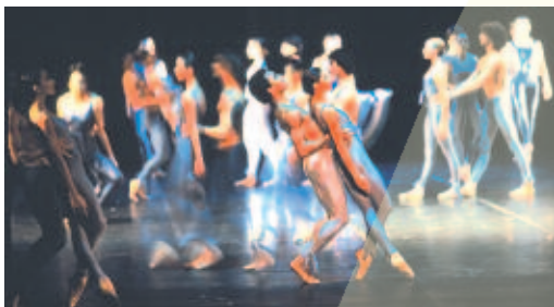
Light - Ballet du XXe siècle